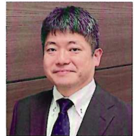
税理士法人ゆびすい 東京支店 支店長 社員・税理士

今回は学校法人におけるインボイス制度への対応について取り上げていきますが、そのためにまず、消費税の仕組みを解説いたします。