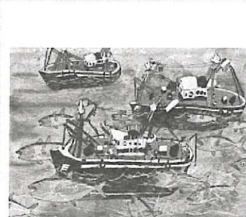
「一攫千金！マグロの群れだぞ」