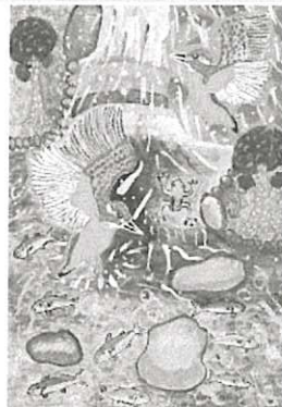
「いつか会いたい！カワセミに」