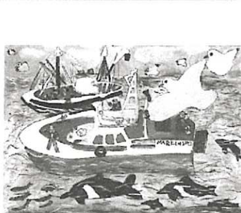
「イルカとカモメのいる早朝の海」